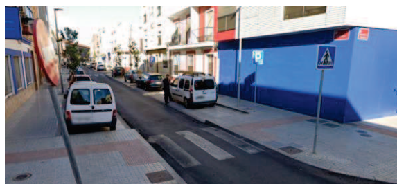
Grupo en Calle Colombia (antes y después de la obra y autorización aparcamientos especiales).

La AAVV propone colocar el grupo de la calle Goya en la calle Sebastián de Benalcázar para que se consiga reducir el impacto del grupo grande cerca de los Jardines. Este movimiento no procede ya que nuestro vehículo no tendría garantías de salida por la calle Pintor Mariano Belmonte al existir estacionamiento de vehículos en ambos lados.