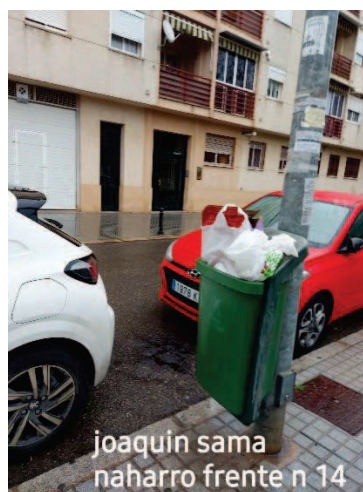
Nexo .: 227.027

Las papeleras situadas en Sama Naharro en el tramo indicado se retiraron por mal uso por parte del ciudadano.