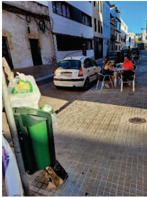
Nexo .: 187.812 (1)

Las Papeleras situadas en Calle Buenos Aires se eliminaron por petición de los comercios ( Nexo 187.812 ) y por continuo mal uso por parte de los ciudadanos depositando bolsas de basura ( Nexo 230.719 ) por lo que no procede su colocación.