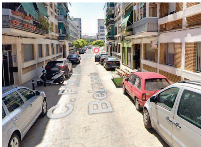
Calle Pintor Mariano Belmonte

La AAVV propone colocar el grupo de la calle Goya en la calle Sebastián de Benalcázar para que se consiga reducir el impacto del grupo grande cerca de los Jardines. Este movimiento no procede ya que nuestro vehículo no tendría garantías de salida por la calle Pintor Mariano Belmonte al existir estacionamiento de vehículos en ambos lados.