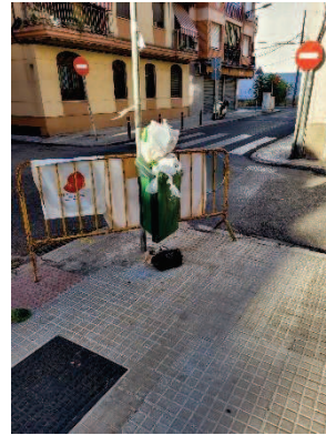
Nexo .: 187.812 (2)